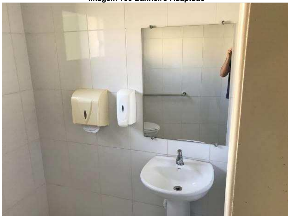
Imagem 10c Banheiro Adaptado