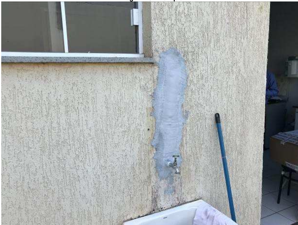
Imagem 20 – Tanque

Parte de uma tubulação de água do tanque externo ao Fórum não possui acabamento.