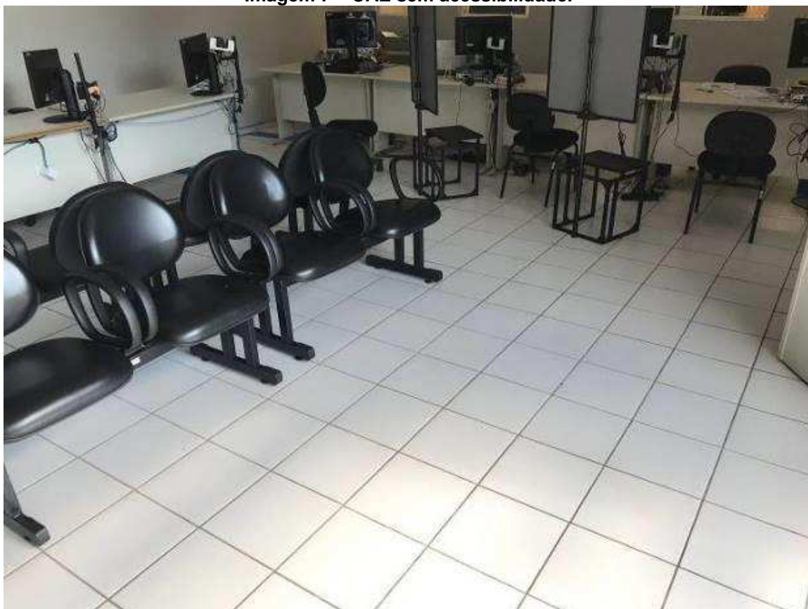
Imagem 7 – CAE sem acessibilidade.

O Fórum não possui alarme de emergência sonoro e visual de acordo com o princípio dos dois sentidos, devendo ser instalado.