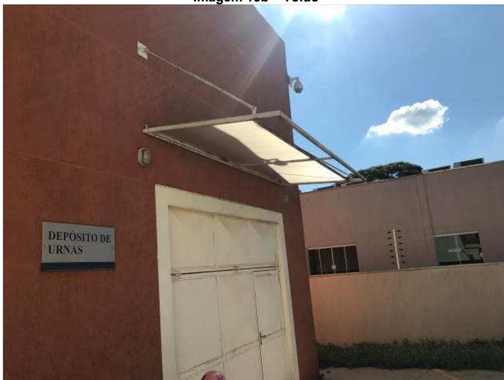
Imagem 19b – Toldo