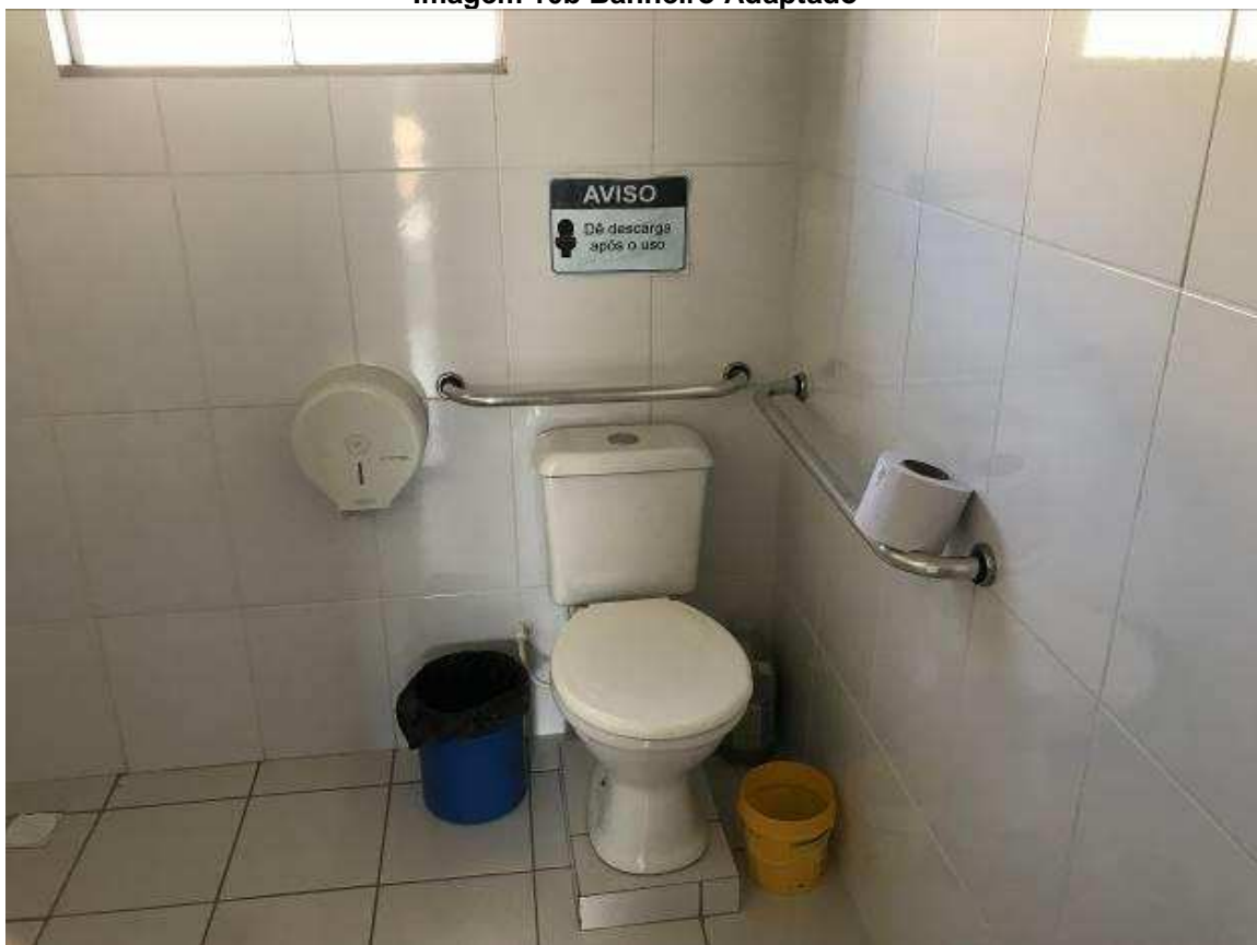
Imagem 10b Banheiro Adaptado