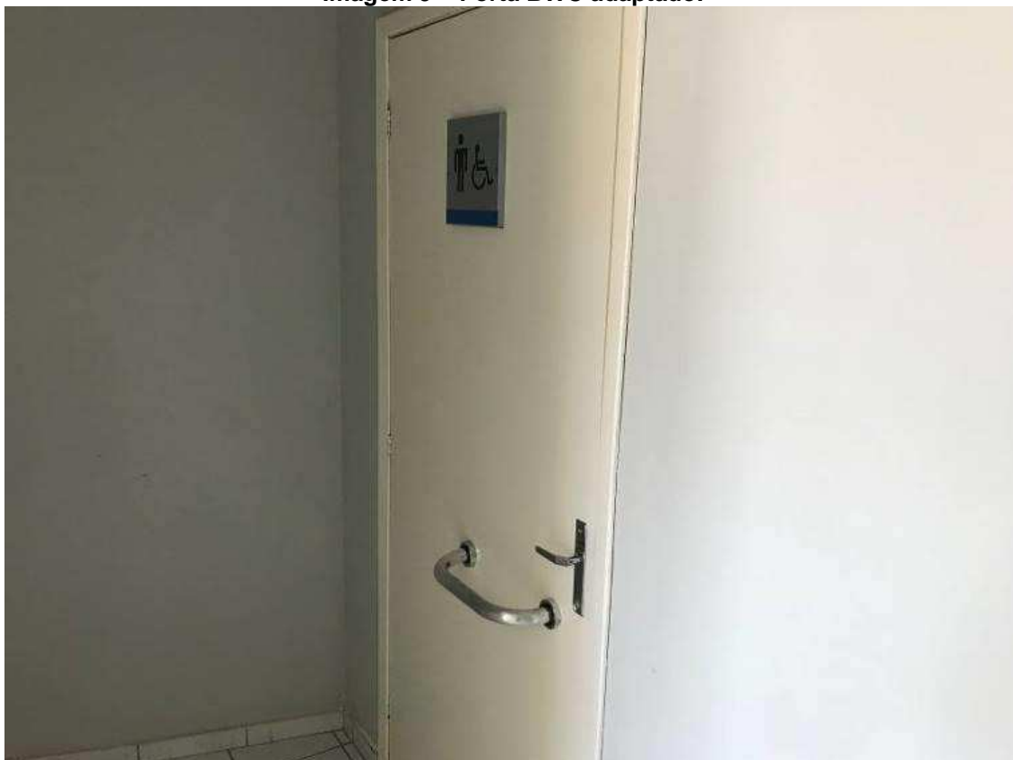
Imagem 9 – Porta BWC adaptado.