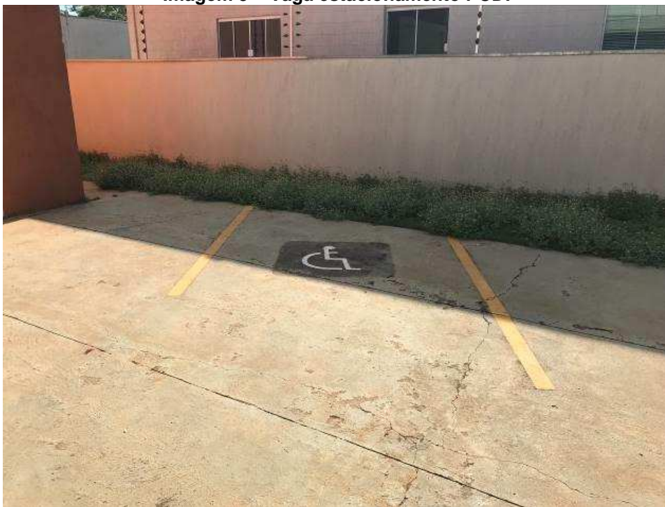
Imagem 5 – Vaga estacionamento PCD.