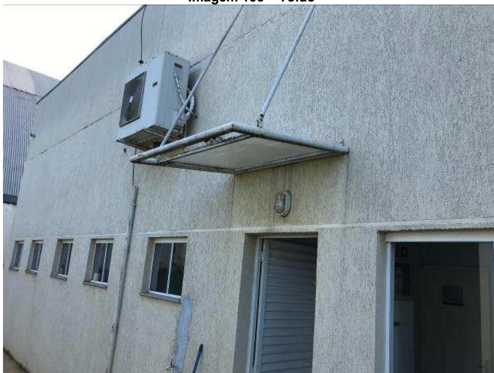
Imagem 19c – Toldo