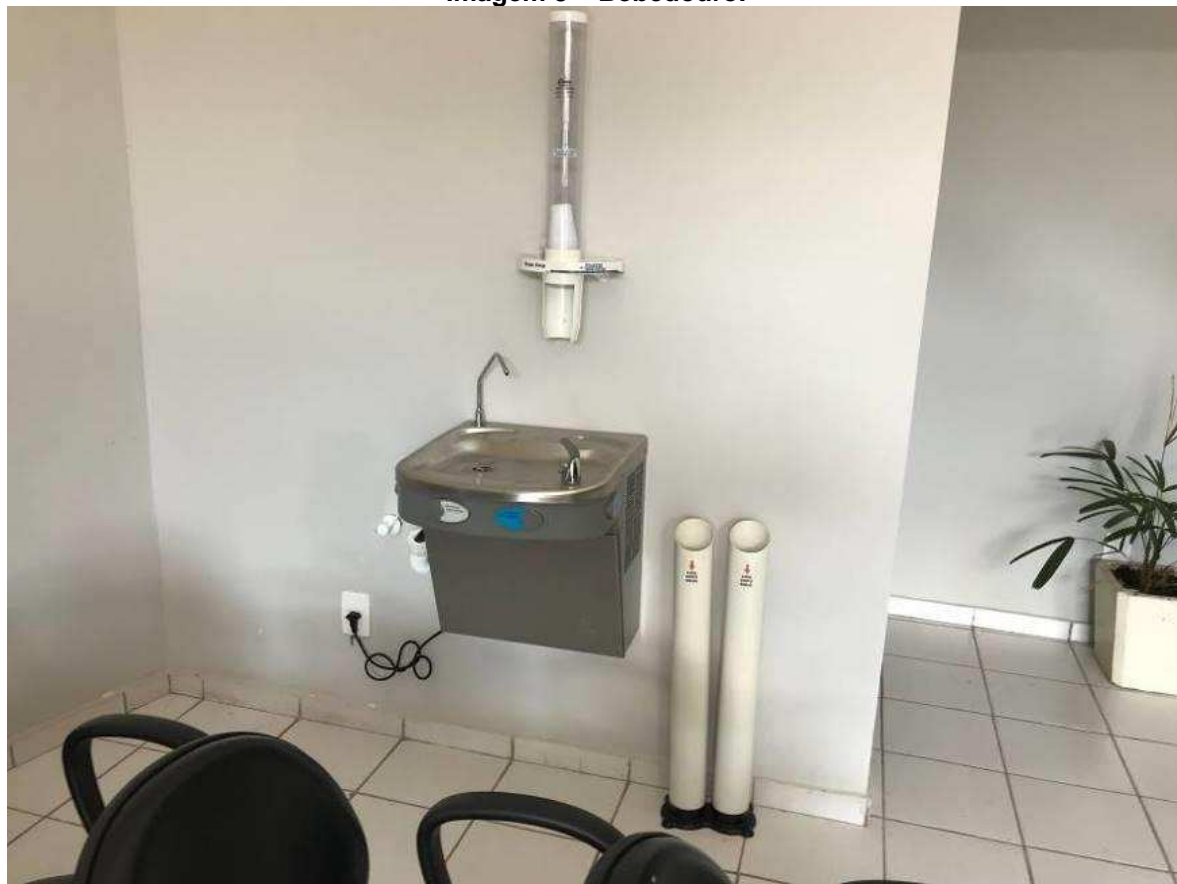
Imagem 8 – Bebedouro.