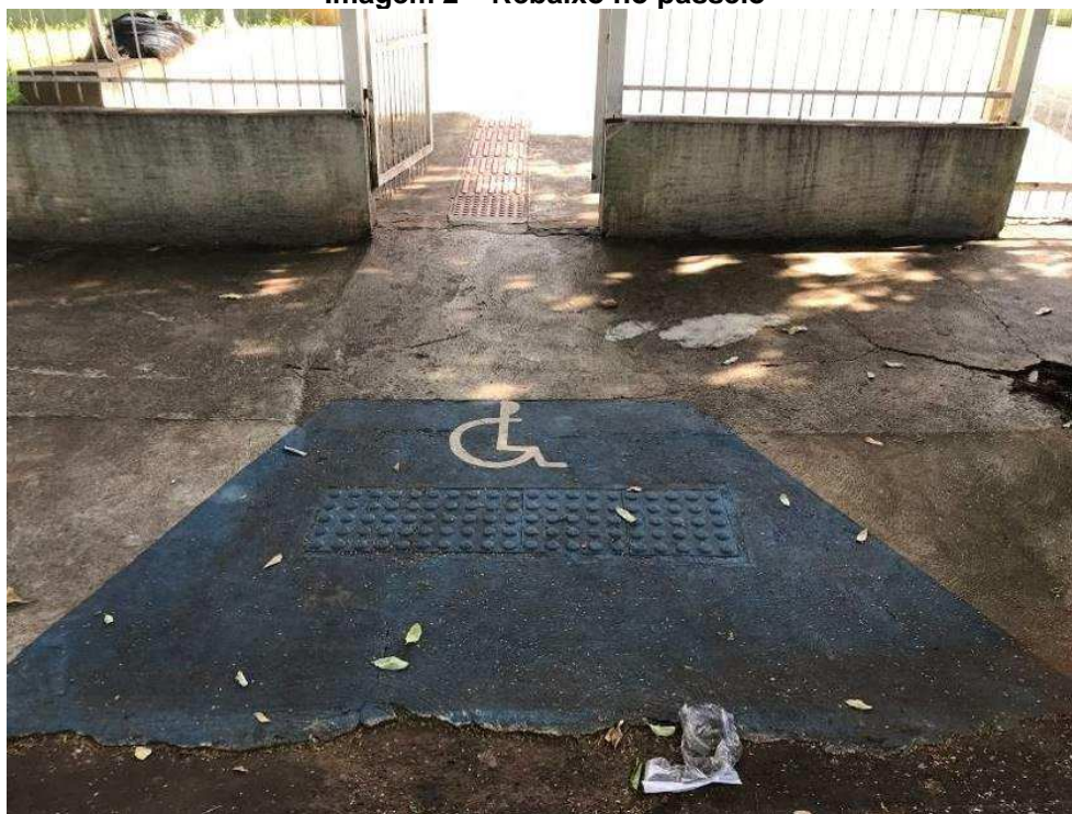
Imagem 2 – Rebaixo no passeio