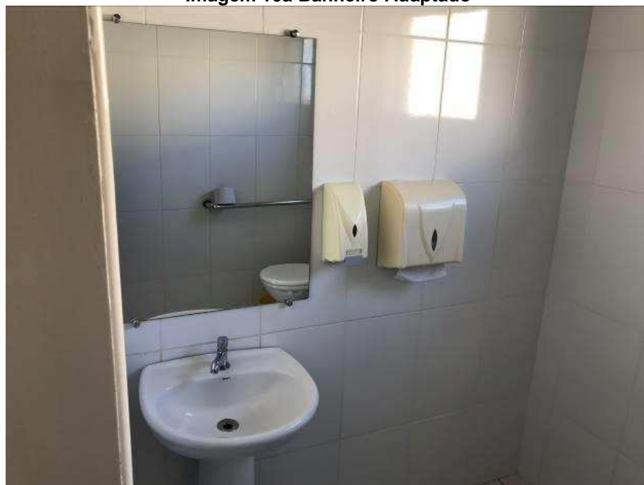
Imagem 10a Banheiro Adaptado

Nas imagens 10 a, b, c e d, pode-se visualizar os banheiros adaptados.