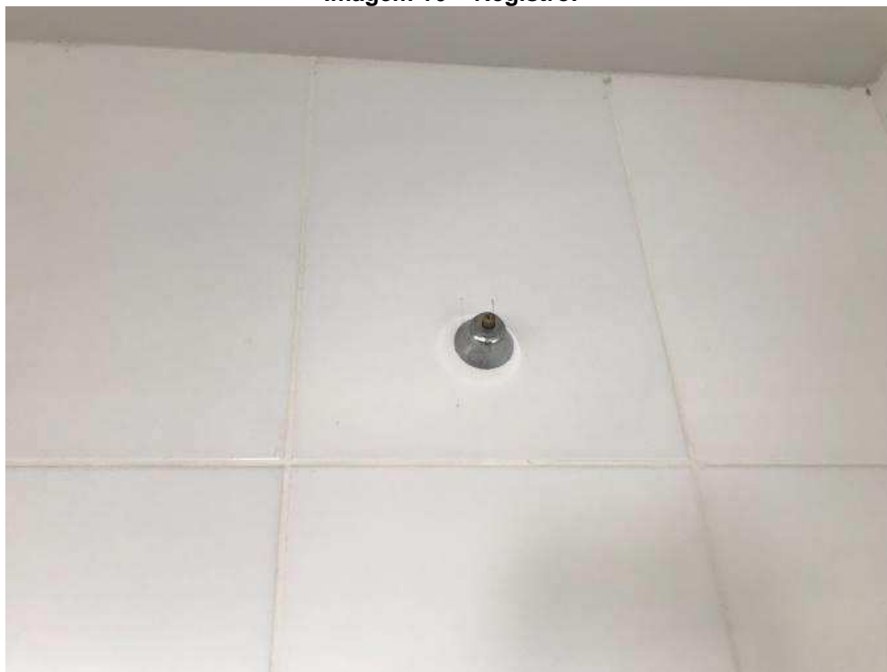
Imagem 16 – Registro.

Existe um registro de banheiro que está sem o acabamento, impossibilitando seu acionamento.