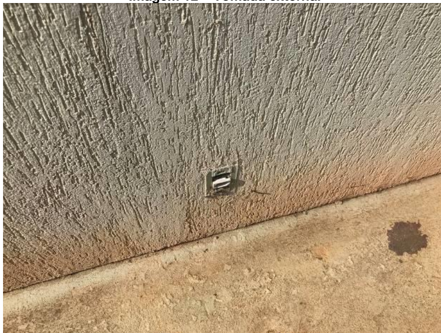
Imagem 12 – Tomada externa.