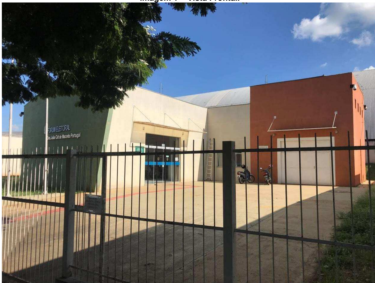
Imagem 1 – Vista Frontal.

A imagem frontal do Fórum Eleitoral está apresentada na Imagem 1.