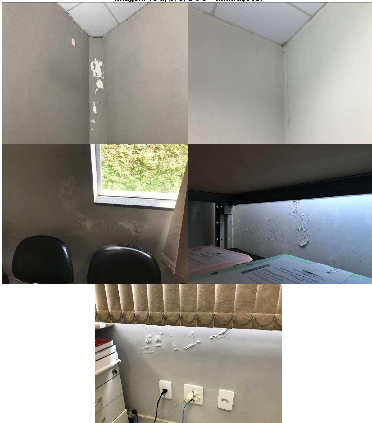
Imagem 15 a, b, c, d e e – Infiltrações.

Foram identificadas infiltrações nas janelas do cartório eleitoral, da sala de audiência, do depósito, junto ao forro da CAE, no corredor entre os banheiros e a CAE, sobre o atendimento da CAE, na parede entre a sala de audiência e a sala do juiz e sobre o fogão da cozinha. As infiltrações são ilustradas na imagem 15