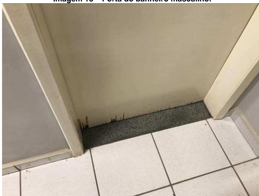
Imagem 13 – Porta do banheiro masculino.

Na Imagem 13 é possível visualizar que a porta do banheiro masculino está danificada na borda inferior, a mesma apresenta problemas de emperramento.