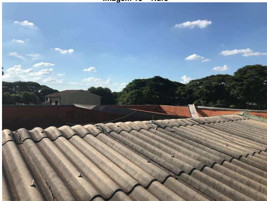
Imagem 18 – Rufo