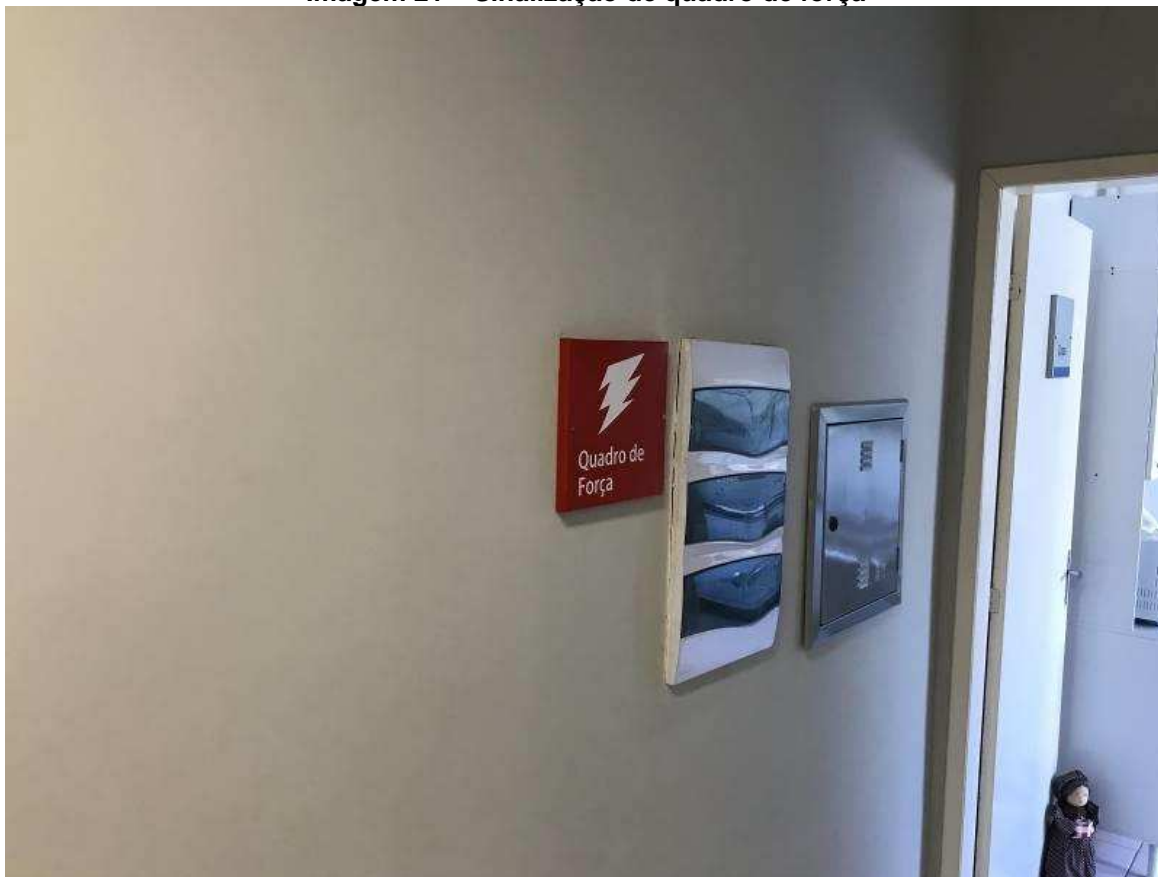
Imagem 21 – Sinalização de quadro de força