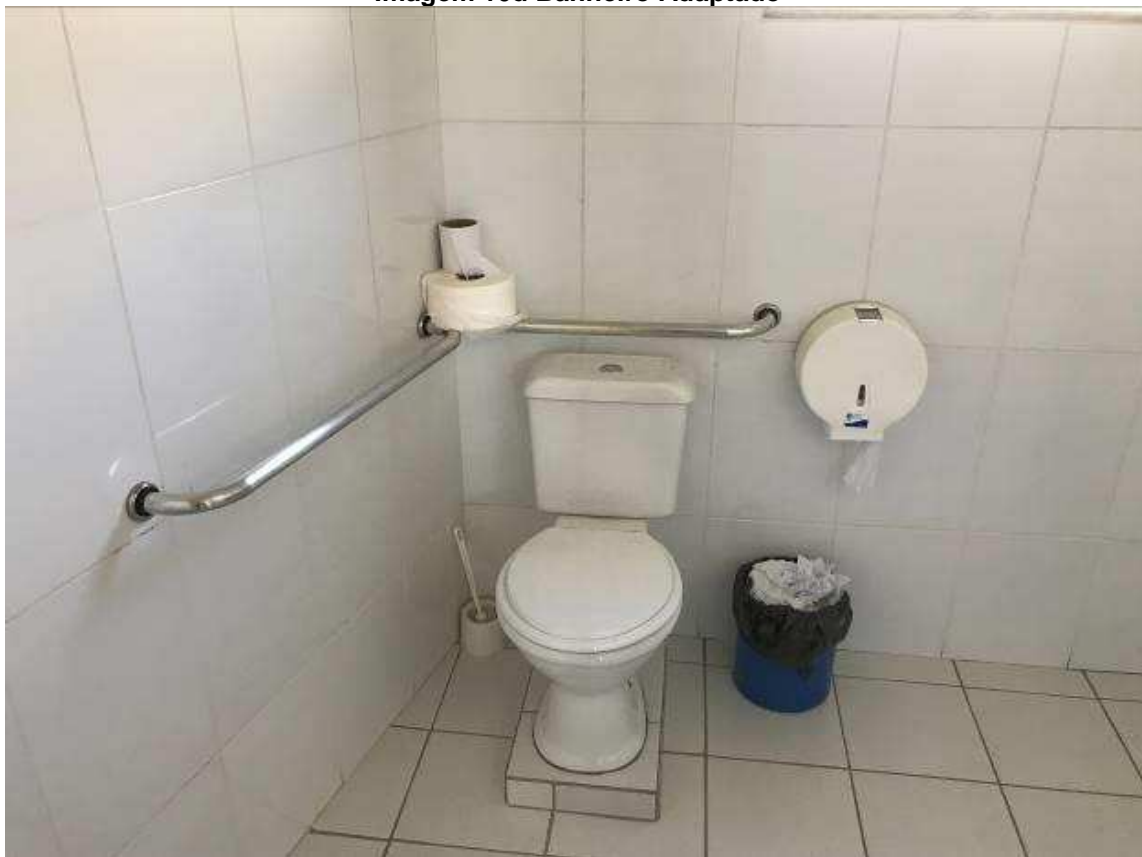
Imagem 10d Banheiro Adaptado