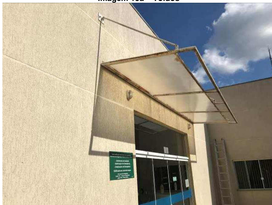
Imagem 19a – Toldos

Os toldos sobre as portas do Fórum estão sem rufo, e a pintura está comprometida, como mostram as imagens.