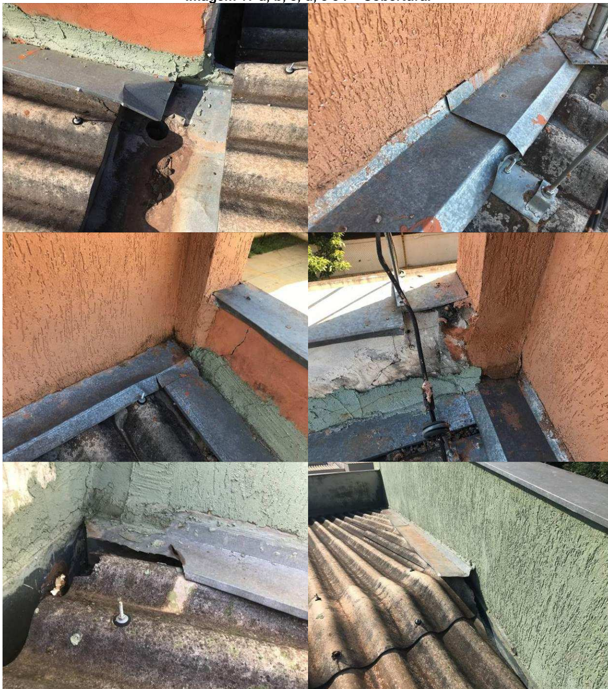
Imagem 17 a, b, c, d, e e f – Cobertura.