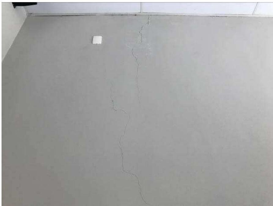
Imagem 14b – Fissuras