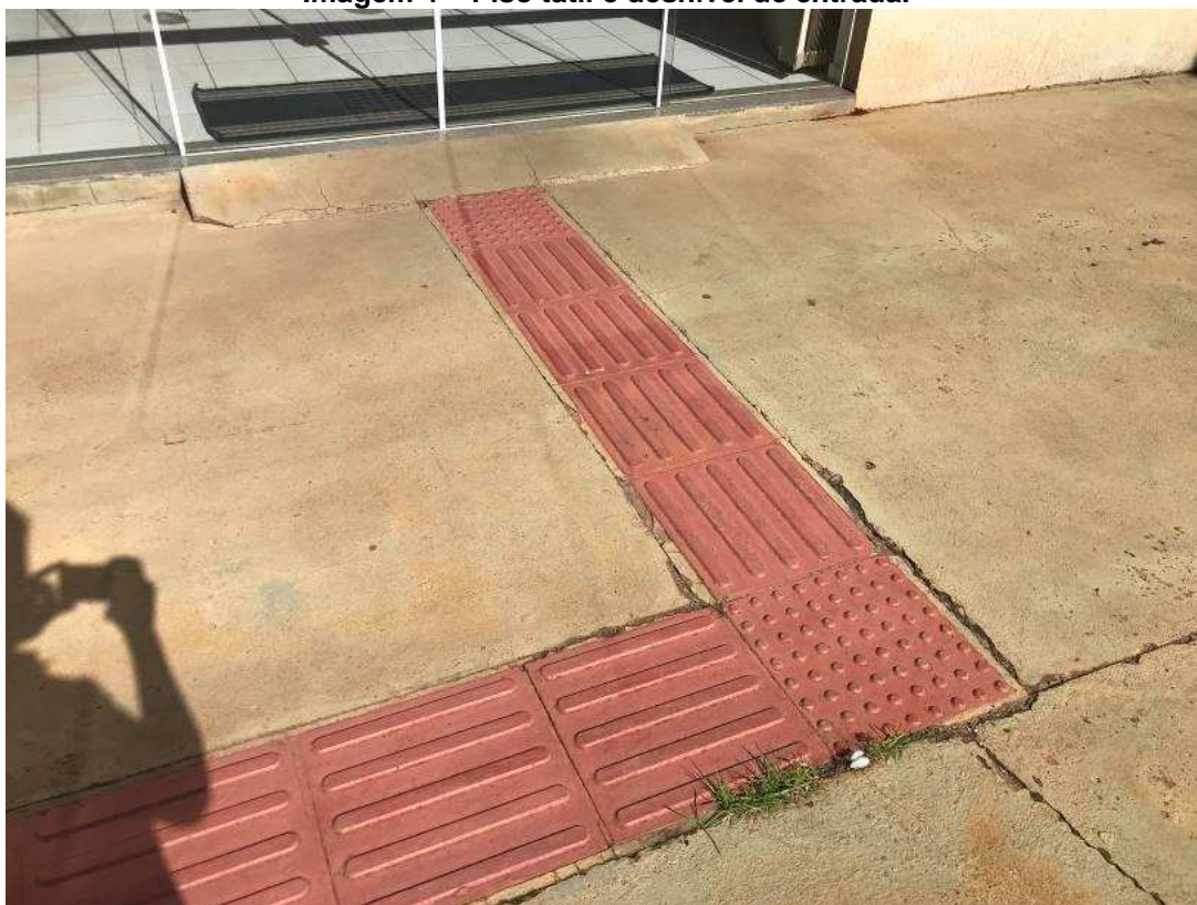
Imagem 4 – Piso tátil e desnível de entrada.

Na Imagem 4, é possível visualizar a necessidade de readequação da quantidade de placas de alerta, tanto da mudança de direção quanto na entrada da CAE, é possível observar fissuras ao longo das bordas das peças de piso tátil, apresentando o desgaste do piso existente. Também é visível a rampa de acesso à entrada da CAE, em desconformidade com a norma vigente.