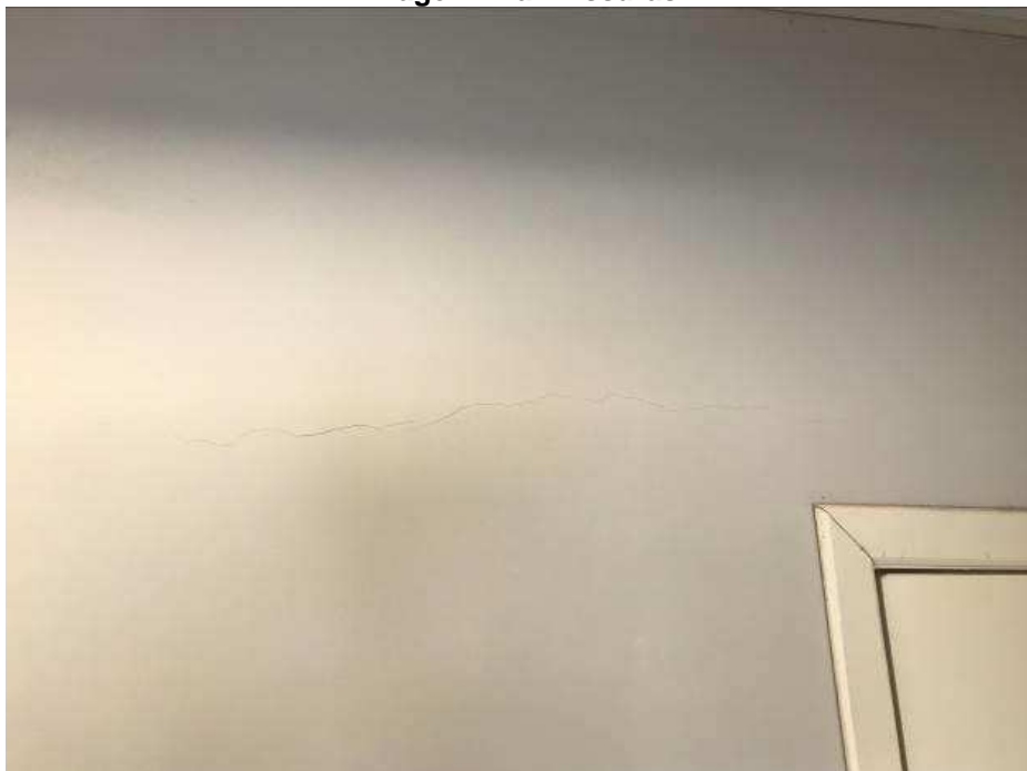
Imagem 14a– Fissuras

Como consta nas imagens a seguir, foram encontradas fissuras na parede do corredor entre os banheiros adaptados e a CAE e na parede da CAE.